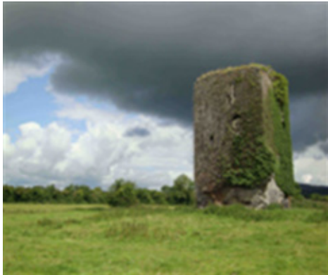
Páirc an Chaisleáin, Cúirt an Chantualaigh

Chomhchistigh an Chomhairle Oidhreachta an tionscadal faoi Chlár an Phlean Oidhreachta Contae.