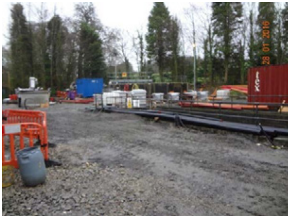
Ionad Cóireála Fuíolluisce Chaisleán an Chomair – Oibreacha ar Bun