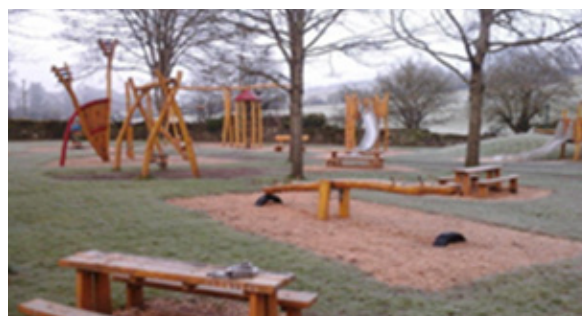
Maidin Gheimhridh i bhFaiche Súgartha Bhaile Mhic Andáin

Tá 23 faiche súgartha ann faoi láthair timpeall an chontae agus tá dhá cheann eile tar éis ardchéim phleanála a bhaint amach a chuirfear i gcrích in 2016. Forbraíodh na háiseanna súgartha seo i gcomhar le pobail áitiúla agus déantar go leor díobh a chothabháil le cúnamh ó phobail áitiúla agus ó scéimeanna fostaíochta pobail áitiúla. Osclaíodh trí fhaiche súgartha in 2015 i mBearna na Gaoithe, Áth Stúin, agus i mBaile Phóil. D'fhorbair grúpaí pobail iad seo le deontas agus le cúnamh teicniúil ón gComhairle Contae agus ó Chuideachta Chompháirtíochta LEADER Chill Chainnigh. Déanann ár gcigire féin inti faiche súgartha gach faiche súgartha a scrúdú gach seachtain chun aon saincheisteanna féideartha sábháilteachta a shainiú, agus déantar iad a ghlanadh chomh maith gach seachtain nó níos minice ná sin, nuair is gá, lena chinntiú go leanann siad bheith sábháilte agus glan lena n-úsáid i measc leanaí.