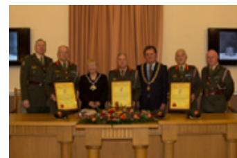
An 7 Nollaig 2015