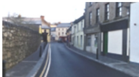
Sráid an Phóipa – I ndiaidh na nOibreacha