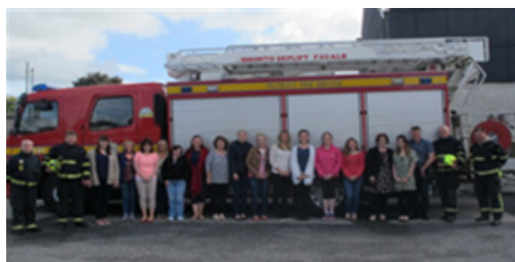
Oiliúint ar Shábháilteacht ó Dhóiteáin do Mhúinteoirí Mheánscoil Chailíní na Toirbhirte a sholáthair Teagascóirí Seirbhís Dóiteáin agus Tarrthála Chill Chainnigh