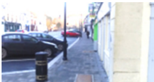
Sráid an Mhargaidh, Baile Mhic Andáin – I ndiaidh na nOibreacha