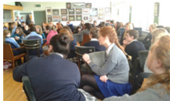
Forbairt Pobail Phort an Chalaidh