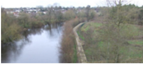
An radharc ó Dhroichead Osraí amach ar Clárchosán na Leacan