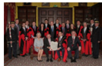
An 10 Aibreán 2015