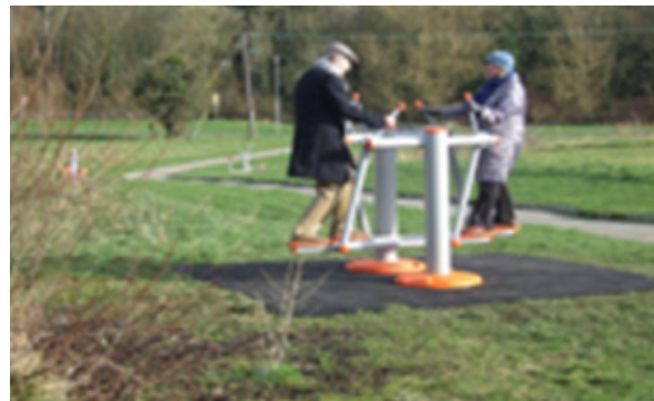
Trealamh aclaíochta taobh amuigh ag Páirc Líneach na Feoire

D'éirigh le hiarratas na Comhairle ar thrí dheontas chun trealamh d'ionad aclaíochta taobh amuigh a sholáthar ag láithreacha ar fud na cathrach. Tá an chuma air go bhfuil an-tóir ar an trealamh aclaíochta seo, go háirithe nuair a bhíonn siad suite in aice saoráidí reatha. I ndiaidh comhairliúchán poiblí a dhéanamh, tabharfar na hionaid aclaíochta taobh amuigh isteach in 2016.