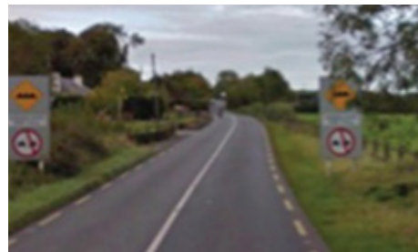
N77 Baile na Slí roimh na hOibreacha