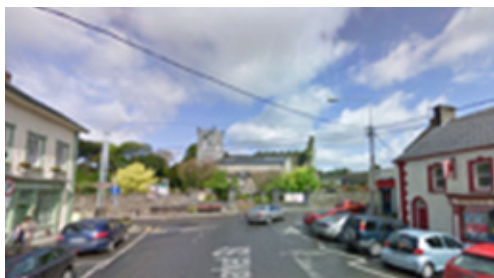
Sráid an Mhargaidh, Baile Mhic Andáin – Roimh na hOibreacha

Faoi Ais 3 agus 4 den Chlár Forbartha Tuaithe 2007-2012, chuir Comhairle Contae Chill Chainnigh, i gcomhpháirtíocht le Comhpháirtíocht LEADER Chill Chainnigh agus na nGrúpaí Pobail Áitiúil faoi seach, ceithre Scéim Athnuachana Uirbí agus Sráidbhaile chun cinn, ina measc Callainn, Gráig na Manach, Béal Átha Ragad agus Baile Mhic Andáin. Miondealaíodh an struchtúr cistithe laistigh den chomhpháirtíocht seo mar seo a leanas: Comhpháirtíocht LEADER Chill Chainnigh (75%), Comhairle Contae Chill Chainnigh (20%) agus an Grúpa Pobail Áitiúil faoi seach (5%). Críochnaíodh scéimeanna Challainn agus Ghráig na Manach in 2014 agus osclaíodh scéim Bhéal Átha Ragad go hoifigiúil i mBealtaine 2015. Críochnaíodh scéim athnuachana Bhaile Mhic Andáin, inar cuireadh feabhas ar Shráid an Mhargaidh agus Sráid an Phóipa, den chuid ba mhó i Ráithe 2 2015. Rinne an tionscadal soláthar d'uasghrádú timpeallachta a dhéanamh ar an sráid-dreach reatha agus ábhair phábhála agus troscán sráide ardchaighdeán á n-úsáid, anuas ar cháblaí reatha seirbhíse lasnaide a chur faoin talamh.