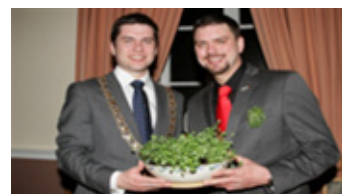
An 17 Márta 2015