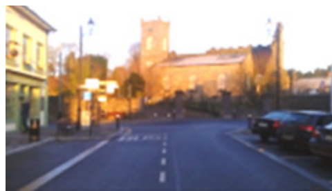
Sráid an Mhargaidh – I ndiaidh na nOibreacha