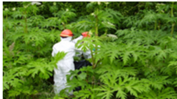
Ag Tabhairt faoi Fheabhrán Capaill

Tugann an Rannóg Páirceanna faoi leathadh speiceas ionrach a chosc ar thailte poiblí ar fud an chontae. Tá clár díothaithe Feabhrán Capaill ar bun go fóill i gCill Mhíic Bhúith agus i gCill Chainnigh, tá iarrachtaí á ndéanamh go fóill chun speicis ionracha a dhíothú feadh na Feoire, go háirithe feadh Shiúlán na Leacan agus Shiúlán na Canála i gcomhar le 'Coimeád Cill Chainnigh Álainn' ('Keep Kilkenny Beautiful').