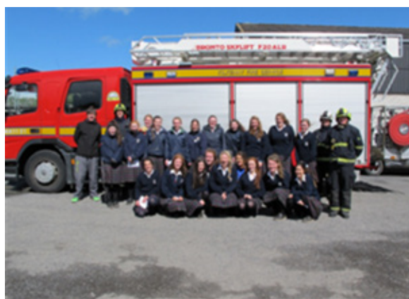
Oiliúint Sábháilteachta Dóiteáin le haghaidh Dhaltaí na hÍdirbhliana