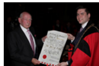
An 13 Bealtaine 2015

An 13 Bealtaine, 2015 Chuir Méara agus Comhaltaí Tofa Cheantar Bardasach Chathair Chill Chainnigh fáiltiú sibhialta ar bun chun rannchuidiú Chomhaltaí na bhFórsaí Cosanta a thabhairt chun suntais, a bhí bunaithe i mBeairic James Stephens, Cill Chainnigh, a rinne ionadaíocht d'Éirinn ar Mhisin faoi shainordú na Náisiún Aontaithe ar mhaithe le síocháin dhomhanda.