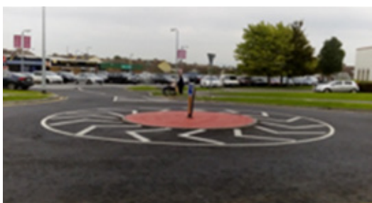
Oibreacha críochnaithe ag Bóthar Bhóthar an Tondais