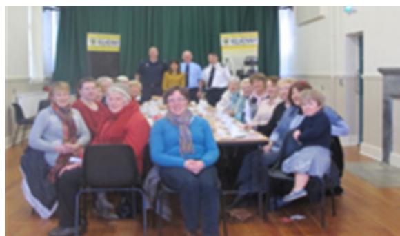
Caint ar Shábháilteacht Dóiteáin sa Bhaile le Pobal Dhroichead Binéid