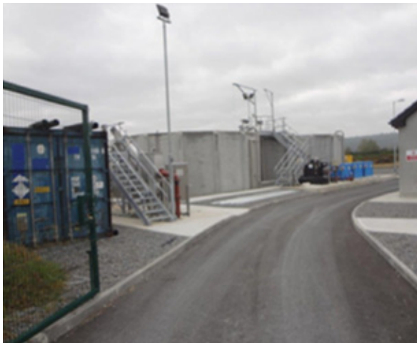
Ionad Cóireála Fuíolluisce Achadh Úr