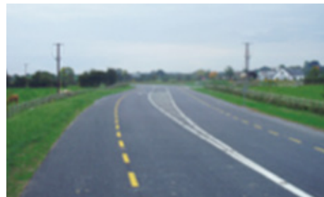
N77 Baile na Slí i ndiaidh na nOibreacha