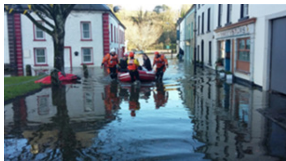
Muintir an phobail á tarrtháil ag Comhaltaí Chosaint Shibhialta Chill Chainnigh óna dtithe tuile in Inis Tíog