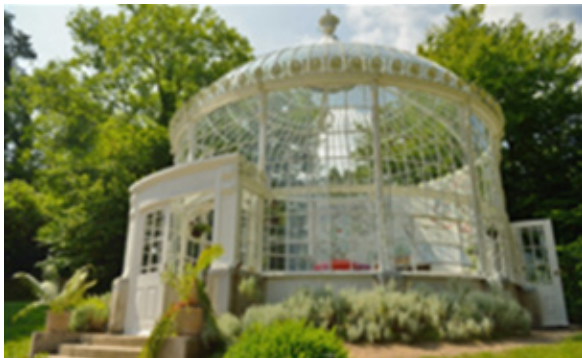
Teach Gloine Turner i gCluain Dúin ina bhfuil an seomra tae suite

Ó rinneadh na gairdíní stairiúla Victoiriacha ag Cluain Dúin a athchóiriú le roinnt blianta anuas, rinneadh mórcheann scríbe do thurasóirí astu san oirdheisceart agus meallann siad anois thart ar 35,000 cuairteoir sa bhliain. Leanann an Chomhairle le himeachtaí a eagrú, cuairteoirí a chothú agus a bhainistiú a thagann a fhad leis na gairdíní, anuas ar thabhairt faoi chothabháil ardchaitheamh. D'óstáil foireann an ghairdín Scoil Foraoise sna gairdíní ar a raibh an rath geal in 2015, anuas ar roinnt imeachtaí, ar nós treordóireachta, siúlóidí sealgaireachta, Siúlóidí de chuid Operation Transformation agus imeachtaí teaghlach eile le haghaidh Sheachtain na hOidhreachta. Tá an-tóir ag teacht ar Chluain Dúin le haghaidh searmanais shibhialta agus in 2015, bhí Cluain Dúin ina n-óstach ar líon póstaí le haghaidh lánúineacha dá lá mór.