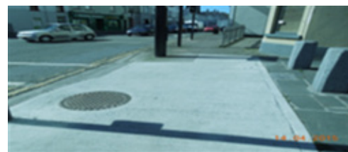
Acomhal an Bhaile Ghaelaigh i ndiaidh na hOibreacha