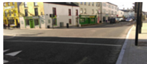
Acomhal an Bhaile Ghaelaigh roimh na hOibreacha

I rith 2015, críochnaíodh breis oibreacha ar an Míle Meánaoiseach. Corpraíodh anseo an stráice den chosán ón trasrian do Choisithe ag siopa Lifestyle Sports go dtí Lána Evans agus an tairseach ardaithe ar an mbóthar ag Acomhal an Bhaile Ghaelaigh. Áiríodh leis na hoibreacha athphábháil cosán, troscán nua sráide a shuiteáil, Bánna Lódála a bhaint agus a athlonnú agus athdhromchlú an bhóthair.