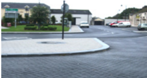
An Chearnóg, Béal Átha Ragad – i ndiaidh na nOibreacha

The Ballyragget Village Renewal Scheme was Fógraíodh Scéim Athnuachana Shráidbhaile Bhéal Átha Ragad faoi agus faoi réir phróiseas Pleanála Chuid 8 agus ghlac an Chomhairle léi go foirmiúil i Meán Fómhair 2013. Shín an Scéim seo ar feadh 1.2km trí Shráidbhaile Bhéal Átha Ragad feadh Shráid an Chaisleáin go dtí pointe 200m lastuaidh de Dhroichead na Feoire. Cistíodh agus tógadh an tionscadal seo trí dhá shreabhadh cistithe ar leith. Rinneadh Céim a hAon de thaobh tuaisceartach na Cearnóige a chomhchistiú idir Chomhairle Contae Chill Chainnigh, Comhpháirtíocht LEADER Chill Chainnigh agus Coiste Forbartha Bhéal Átha Ragad agus tugadh oibreacha ar an gcéim thosaigh seo chun críche in 2014. Chistigh Bhoneagar Iompair Éireann Céim 2 faoi Chlár Feabhsúchán Pábhála agus Mionoibreacha HD28.