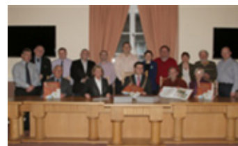
An 30 Márta 2015