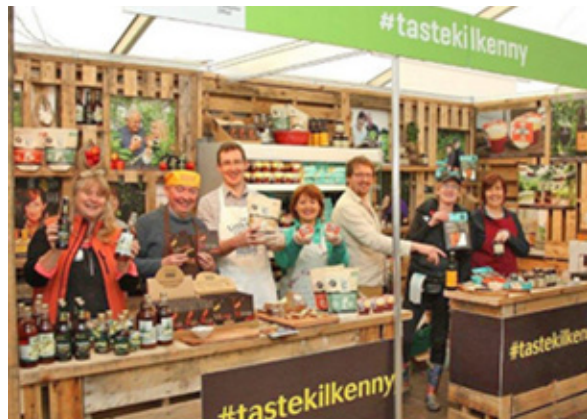
Comhaltaí líonra bia #tastekilkenny i mbun taispeántais ag an gComórtas Náisiúnta Treabhdóireachta

D'eagraigh OFÁ Chill Chainnigh Clár Tosaithe an Acadaimh Bhia le haghaidh táirgeoirí bia agus dí atá bunaithe sa chontae in 2015. Is é an tAcadamh Bia an clár oiliúna nua atá dírithe ar thacú le gnólachtaí nuathionscanta bia agus iad a chothú. Tá an Bord Bia, SuperValu agus an OFÁ ag oibriú as lámh a chéile ar an tionscnamh seo chun leibhéal comhsheasmhach d'eolas margaíochta bia a sholáthar do ghnólachtaí nua agus luathchéime bia. Tá an clár in ainm is cuideachtaí a threorú óna dtionscnamh go dtí a gcéad liostú miondíola. Rinne na rannpháirtithe ar éirigh leo an clár a chríochnú i gCill Chainnigh anuraidh an cinneadh chun #tastekilkenny chun taispeántas a dhéanamh sa Sráidbhaile Fiontair Áitiúil ag an gComórtas Náisiúnta Treabhdóireachta a bhí ar siúl i Ráth an Uisce, Contae Laoise. Ag eascairt ón rath a bhí orthu ag an gComórtas Treabhdóireachta, rinne an grúpa taispeántas ag Savour Kilkenny agus BITE 2015. Áirítear le #tastekilkenny roinnt táirgeoirí dea-bhunaithe bia agus deochanna ceardaí, ina measc Feirm Bhreac Goatsbridge, The Little Mill Company agus Highbank Orchard, anuas ar tháirgeoirí a bhfuil an margadh bainte amach acu le déanaí: Mooncoin Home Preserves, Bernie's Farmhouse Desserts, Made in Heaven, Inistioge Food Company agus Costello's Brewing Company.