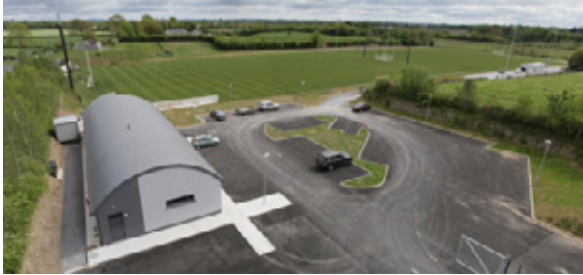
Faichí Oilíúna nua CLG ar iar-thailte líonadh talún ag an Dún Mór. Seirbhísí Athchúrsála na Comhairle