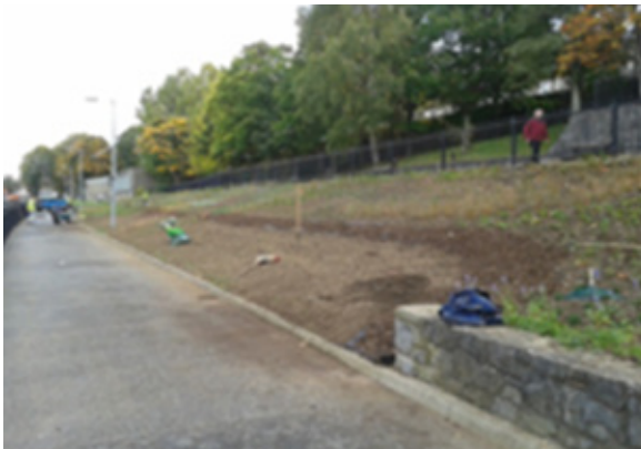
Na plandaí á leagan amach do thionscadal an phailneora

Is é an téama lárnach i gCur Ghairdín na Síochána faoinar tugadh san fhómhar tacú le Feithidí Pailnithe. Dearadh an cur ag an láthair seo go soláthróidh sé pailin agus neachtar ó thráth luath san earrach ar aghaidh agus go mbeidh roinnt bleibeanna i mbun bláthú ó Fheabhra go Meitheamh, agus uaidh sin ar aghaidh, beidh na plandaí luibheacha ilbhliantúla faoi bhláth agus soláthróidh siad acmhainn an-dlúth d'fheithidí.